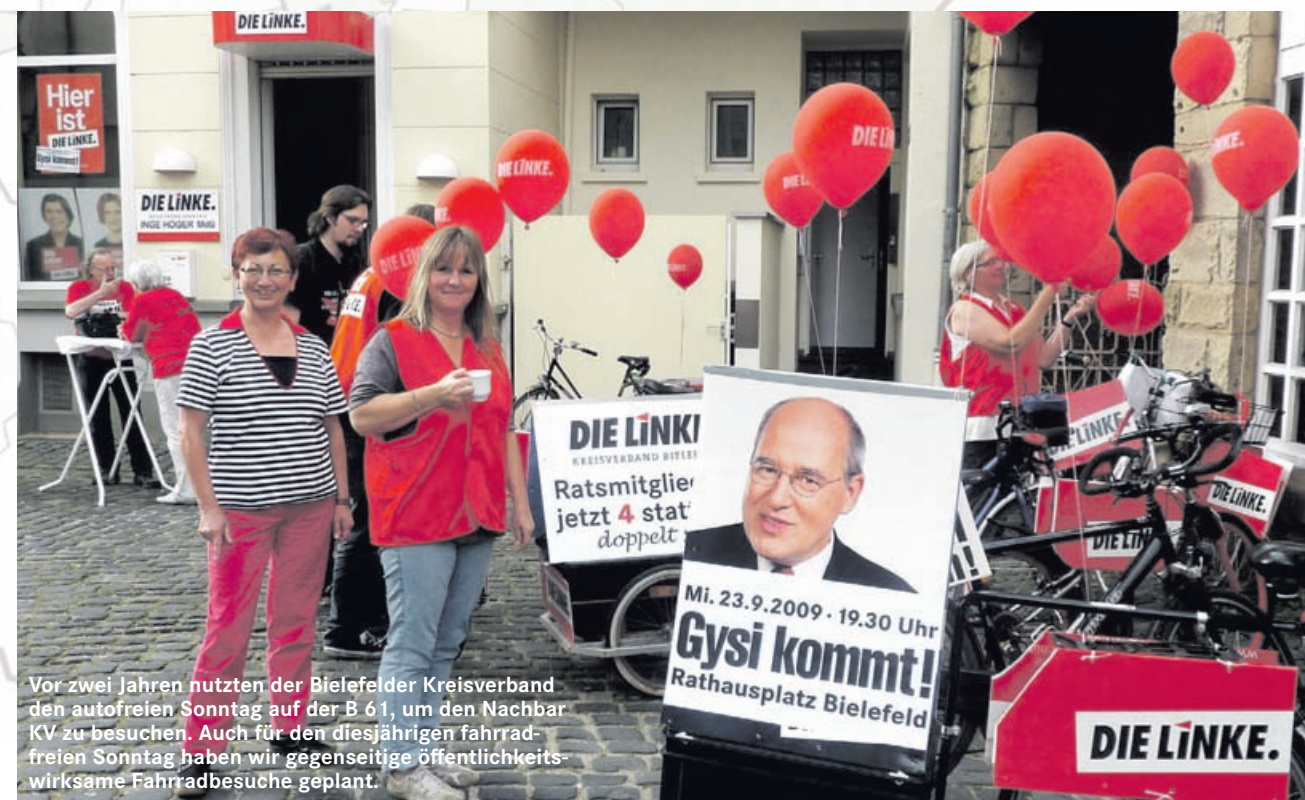
Vor zwei Jahren nutzten der Bielefelder Kreisverband den autofreien Sonntag auf der B 61, um den Nachbar KV zu besuchen. Auch für den diesjährigen fahradfreien Sonntag haben wir gegenseitige öffentlichkeitswirksame Fahrradbesuche geplant.